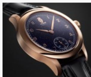
Mit schimmerndem Zifferblatt: die Fort de Lippe Blue Heritage von York

Die junge deutsche Luxusuhrenmarke von York Prinz zu Schaumburg-Lippe hat ihre Serie Fort de Lippe erweitert. Der 44 Millimeter große Zeitmesser mit skelettiertem und graviertem Unitas-Taschenuhrwerk besitzt nun ein schimmerndes Zifferblatt aus Blaufluss. Dabei handelt es sich um ein synthetisches Glas, das hauptsächlich für Schmuckkreationen verwendet wird. Es ist jedoch nicht der Blaufluss, sondern das besonders massive Rosé- oder Weißgoldgehäuse, das dem Uhrenmodell Fort de Lippe Blue Heritage zu seinem hohen Preis von 25.700 beziehungsweise 27.700 Euro verhilft. Hergestellt werden die Varianten je 99-mal bei Schaumburg Watch im niedersächsischen Rinteln. Erhältlich sind sie nach Bestellung und Angabe der gewünschten Seriennummer zwischen 1 und 99 bei Juwelier Becker in Hamburg. Des Weiteren liefert der Markengründer Uhren nach Vereinbarung an Juweliere in der Nähe des Interessenten. ak